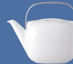
Teekanne | Teapot 1,34 l