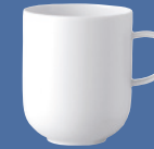
Henkelbecher | Mug 0,35 l