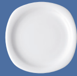
Brotteller | Plate 16 cm