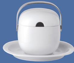
Sauciere | Sauce-boat 0,52 l