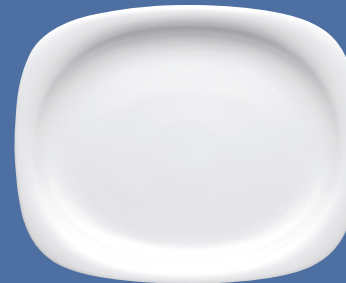
Platten | Platters 24 x 16,5 / 34 x 27 / 38 x 30,5 cm