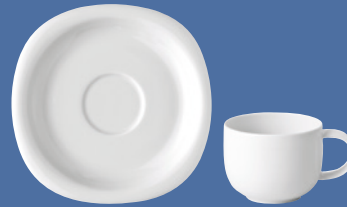
Kaffeetasse | Coffee cup 0,18 l