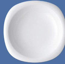
Suppenteller | Plate deep 23 cm