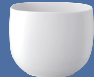
Schüsseln | Bowls 16 / 18 / 19 cm