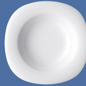
Pastateller | Pasta plate 30 cm