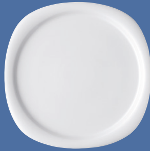
Platzteller | Service plate 32 cm